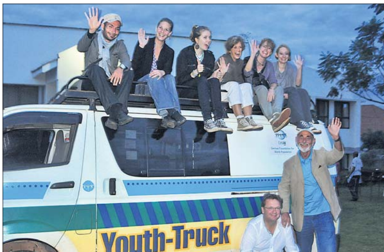
Die Reisegruppe aus Deutschland hatte viel Spaß miteinander (auf dem Bild fehlen Thomas Konzczak und Mathias Siebert).

In Kampala herrscht reges Gewimmel und Treiben auf den Straßen. Zwischen Fußgängern schlängeln sich Radfahrer, Taxi-Mopeds und übervoll besetzte Minibusse durch das Gewühl. Es gibt große Villen, Hochhäuser und weitläufige Parks hinter hohen Mauern. Einerseits. Andererseits erschreckt die Armut der Menschen umso